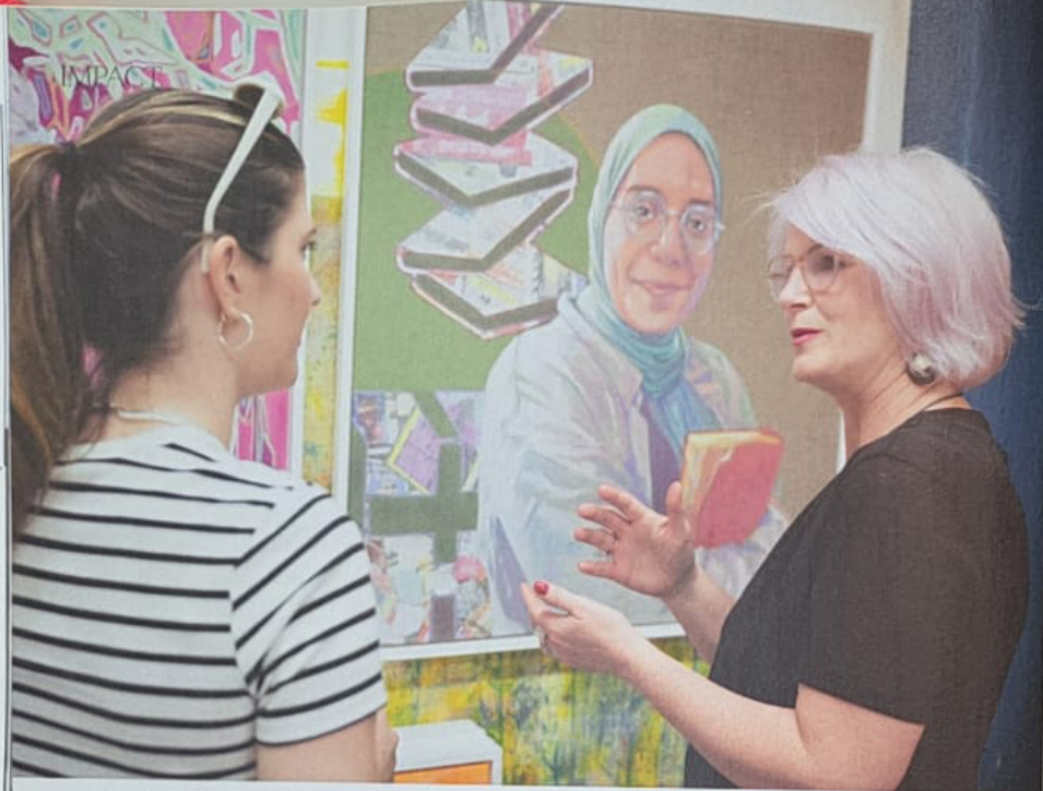
LEIDENSCHAFTLICH. Um die Frauen und ihr Engagement authentisch abzubilden, führte Pacholik im Vorfeld mit jeder von ihnen ausgiebige Gespräche. Die Tonspuren werden im Rahmen der Ausstellung ab 16. Juni im ÖGB Catamaran in Wien über einen QR-Code abrufbar sein.

„Gemeinschaft und Austausch sind das, was Menschen mutig und handlungsfähig hält.“